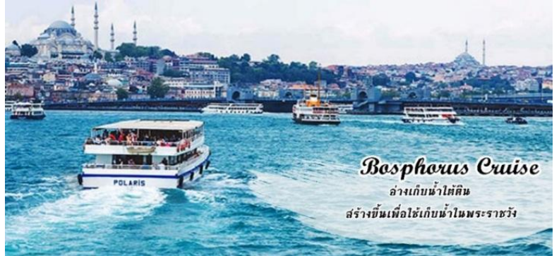
Bosphorus Cruise อ่างเก็บน้ำหิมาลัย สร้างขึ้นเพื่อใช้เก็บน้ำในพระราชวัง

ได้ชมทิวทัศน์ทั้งสองข้างที่สวยงาม ตระการตา "ช่องแคบบอสฟอรัส" เป็น ช่องแคบขนาดใหญ่และสองฝั่งมี ความสวยงามมาก ช่องแคบนี้ทำ หน้าที่เป็นเส้นแบ่งระหว่างยุโรป และ เอเชีย เชื่อมระหว่าง ทะเลดำThe Black Sea เข้ากับ ทะเลมาร์มาร่า Sea of Marmara มีความยาว 32 กิโลเมตร ช่องแคบบอสฟอรัสยังเป็นจุด ยุทธศาสตร์ที่สำคัญยิ่ง ในการป้องกัน ประเทศตุรกีอีกด้วย เพราะมีป้อมปืนตั้งเรียงรายอยู่ตามช่องแคบเหล่านี้